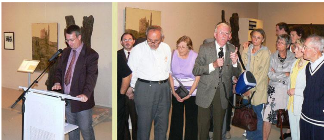
Voorzitter en erevoorzitter tijdens de opening van de tentoonstelling

Het begon al op de opening zelf. Bijna 200 aanwezigen (wat zeer veel is voor een opening) mochten genieten van al die prachtige, ludieke, speelse, originele, historisch belangrijke en authentieke voorwerpen. En dan vergeet ik ongetwijfeld nog enkele bijvoeglijke naamwoorden die in dit rijtje passen. Echt de Kring op z'n best. Onze erevoorzitter heeft nu eenmaal een neus voor dit soort van openbaringen. En natuurlijk konden we dit niet realiseren zonder de steun van het SteM (Stedelijke Musea Sint-Niklaas) en de Erfgoedcel Waasland. Ook de week nadien mochten we tijdens de erfgoedwandelingen van het Davidsfonds Sint-Niklaas 700 bezoekers ontvangen. En dat is ook de bedoeling: niet verzamelen voor onszelf, maar ten dienste van de gemeenschap.